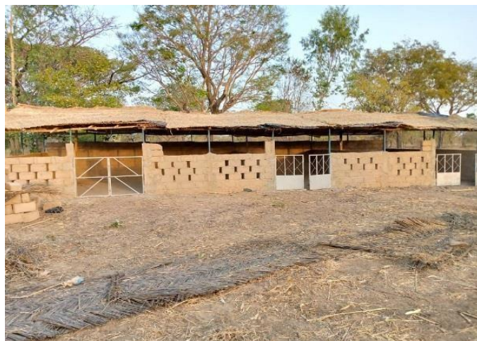
Hokken voor het vee