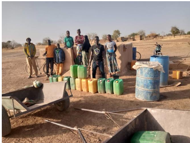
Waterboring met pomp in bedrijf in Witinga