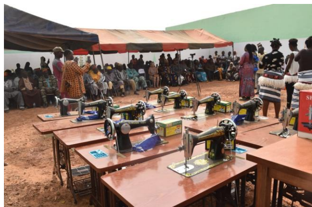
Naaimachines voor de gediplomeerden