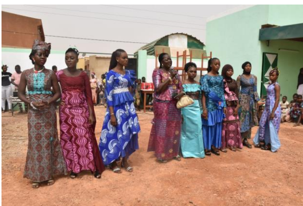
Gediplomeerden van Bianca Couture

Het legaat uit Nederland helpt om een bepaalde zekerheid te bieden voor de toekomst, maar dit laat onverlet dat Bianca Couture ook vooral moet inzetten op het genereren van eigen inkomsten. Dit verkleint de afhankelijkheid van externe bronnen en verhoogt de eigen waardigheid.