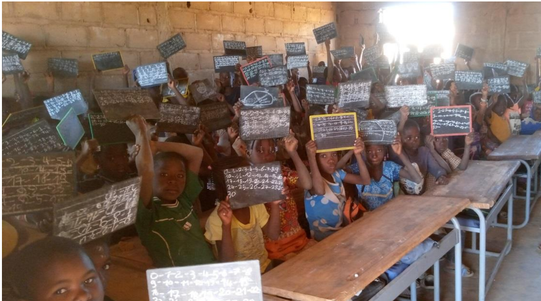
De kinderen in de klas in Loulouka aan hun schoolbanken