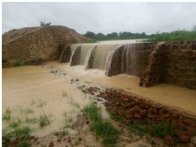
Overloop van een stuwmeertje(bouli) in Guesna