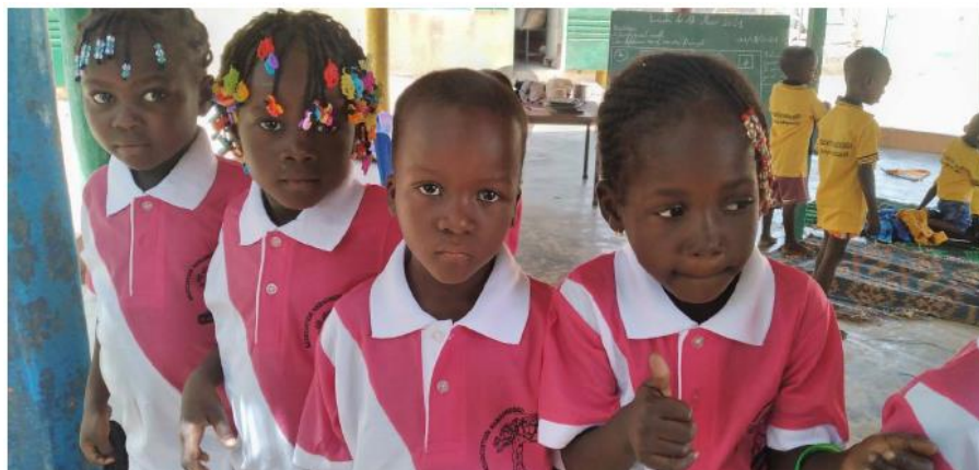
Kinderen bij Bi Songo in Yorgho