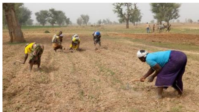
De kinderen in de klas in Loulouka aan hun schoolbanken Ontheemde vrouwen werken aan tuinbouw productie