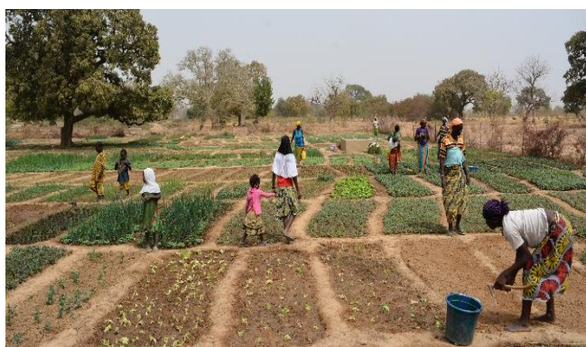
Tuinbouw achter de stuwdam

Sommige dingen beginnen klein en blijven klein of verdwijnen naar de achtergrond. Andere zaken groeien door en worden volwassen. Het plattelandsproject rond Boussé is een mooi voorbeeld van een volwassen geworden project. Samen met CECA zijn we in 2012 begonnen met een plattelandsproject in de omgeving van Bouslé, 50 km. ten noordwesten van Ouagadougou. Eerst enkele waterputten, later werden ook groentetuintjes aangelegd. Daarna een uitbreiding, met steun van onze partner AJF, van 5 dorpen naar 7 dorpen met een omvang van meer dan 50.000 inwoners. Ook het programma is omvangrijker geworden: o.a. - een alfabetiseringsprogramma voor met name ouderen, - aanschaf metalen weefgetouwen waarop vrouwen traditionele kledij weven en vervolgens verhandelen, - introductie van nieuwe landbouwtechnieken waardoor hogere opbrengsten worden verkregen, - realisatie van wateropvangplaatsen om water vast te houden en te gebruiken voor het drenken van kuddes koeien en het telen van groenten. In 2022 zijn de waterreservoirs geëvalueerd door PUM.