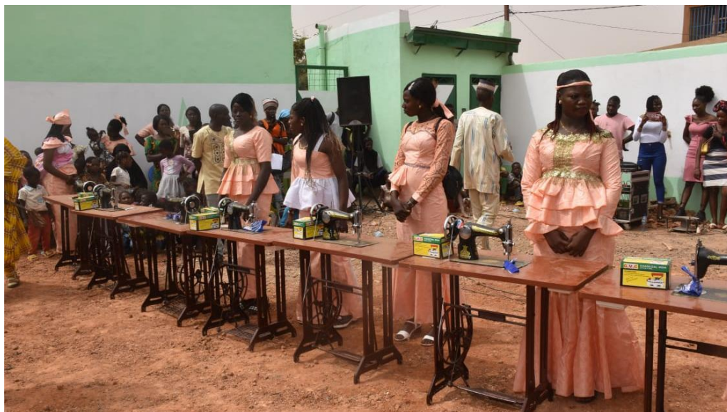
Afgestudeerden in zelf gemaakte jurk met de starterskit

Door inspanning van Sahelp en haar donateurs hebben de afgestudeerden in 2022 een starterskit ontvangen. Hiermee zijn ze in staat in hun eigen inkomen te verdienen.