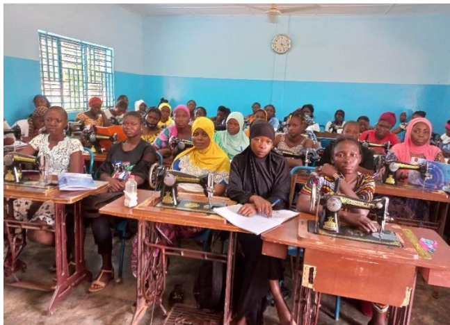
Klas met leerlingen van de naaischool